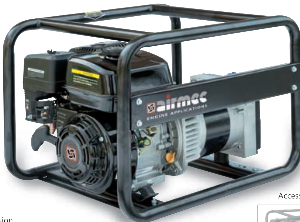
Accessorio - Accessory